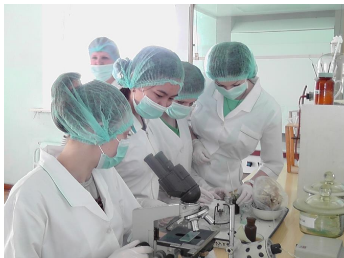
Студенты ГБПОУ «Курганский государственный колледж»

Молодые кадры, ведь это люди со свежими идеями и креативным подходом к решению производственных вопросов. Мы ценим молодых специалистов, которых готовит ГБПОУ «Курганский государственный колледж». Они обладают достаточно большим багажом теоретических знаний, который с обретением должного опыта превратит выпускников в отличных специалистов