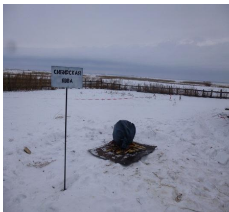
Уничтожение трупа овцы путем сжигания

В ходе совместных действий участники учений отработали действия по ликвидации чрезвычайной ситуации: оборудование дезбарьера, шлагбаума на въезде в населенный пункт, отбор проб, уничтожение трупа животного путем сжигания, дезинфекция помещений и территории, организация подворного обхода, вакцинация животных, медицинские и противозидемические мероприятия.